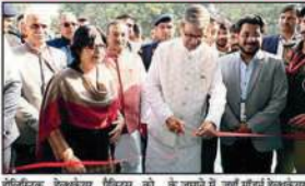
हरियाणा के राज्यपाल ने आयुर्वेद और होलिस्टिक वेलनेस के लिए कमिटमेंट दिखाया।

भारत के पुराने ज्ञान और मॉडर्न साइंटिफिक डिसCOVERIES पर इटैट में रोखी डखी गई पंचकूला, हरियाणा के राज्यपाल ने आयुर्वेद और होलिस्टिक वेलनेस के लिए कमिटमेंट दिखाया। आयुर्वेद सिर्फ दवा नहीं, बल्कि जीवन का दर्शन है। आयुर्वेद सिर्फ दवा नहीं, बल्कि जीवन का दर्शन है।