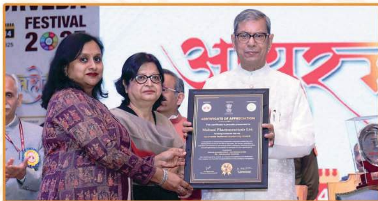
Ayurveda National Leadership Award conferred upon Multani Pharmaceuticals