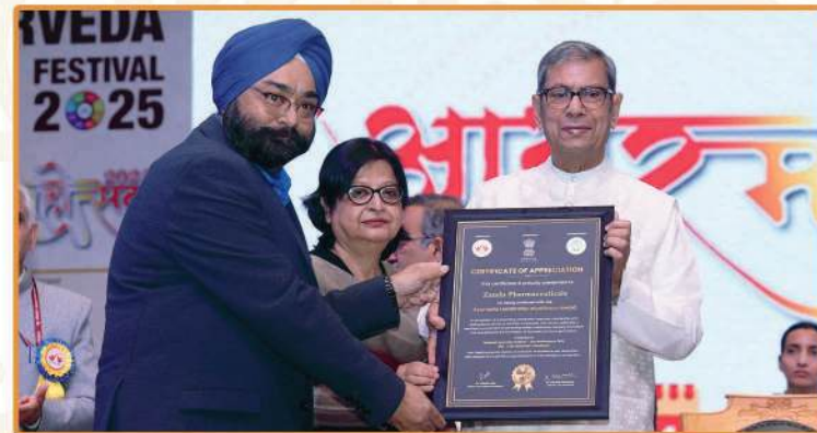
Ayurveda Leadership Excellence Award conferred upon Zandu Pharmaceuticals