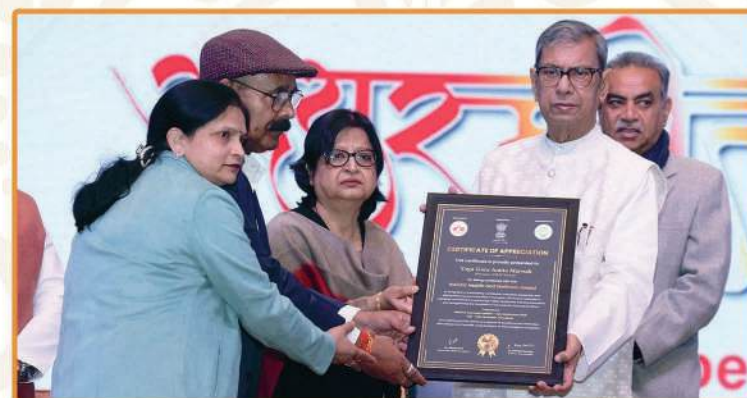
Wellness Brand of the Year conferred upon Amrutam Pharmaceuticals