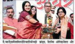
हरियाणा के राज्यपाल ने आयुर्वेद और होलिस्टिक वेलनेस के लिए कमिटमेंट दिखाया।

सिटी दर्पण, मुंबई: आयुर्वेद का अर्थ है 'आयु' अर्थात् जीवन और 'वेद' अर्थात् ज्ञान का एक विज्ञान है। यह जीवन का एक अविनाशनीय धर्म है, जो हमें स्वस्थ और सुखी जीवन देता है। आयुर्वेद सिर्फ दवा नहीं, बल्कि जीवन का दर्शन है। हरियाणा के राज्यपाल ने आयुर्वेद और होलिस्टिक वेलनेस के लिए कमिटमेंट दिखाया। राज्यपाल ने आयुर्वेद और होलिस्टिक वेलनेस के लिए कमिटमेंट दिखाया। राज्यपाल ने आयुर्वेद और होलिस्टिक वेलनेस के लिए कमिटमेंट दिखाया।