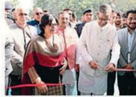
हरियाणा के राज्यपाल ने आयुर्वेद और होलिस्टिक वेलनेस के लिए कमिटमेंट दिखाया।

भारत के पुराने ज्ञान और मॉडर्न साइंटिफिक डिसCOVERIES पर इटैट में रोखी डखी गई पंचकूला, हरियाणा के राज्यपाल ने आयुर्वेद और होलिस्टिक वेलनेस के लिए कमिटमेंट दिखाया। आयुर्वेद सिर्फ दवा नहीं, बल्कि जीवन का दर्शन है। आयुर्वेद सिर्फ दवा नहीं, बल्कि जीवन का दर्शन है।