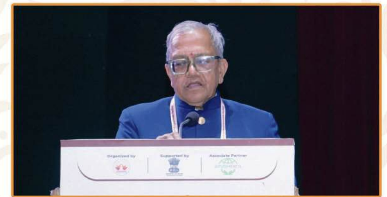
Dr. Rampal Somani Former Minister, Ayurveda, Pharmacopoeia Committee, Ministry of AYUSH, Govt. of India