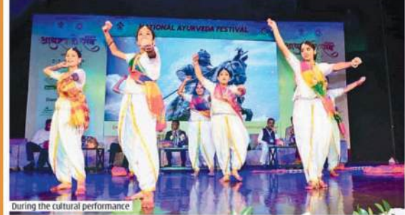
During the cultural performance